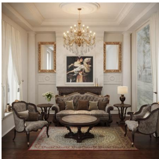
Slika 6: Izrada enterijera prema referentnoj slici za enterijer sa najvišim nivoom vizuelne kompleksnosti