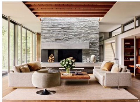
Slika 3: Prikaz enterijera restorana

Na referentnoj slici za enterijer sa srednjim nivoom vizuelne kompleksnosti, uočene su naglašene teksture i materijali koji se vide oko kamina, na tavanici i stolu, kaskade na plafonu, smicanje ravni zida, metalni stubovi pored prozora, kao i određeni dekorativni elementi.