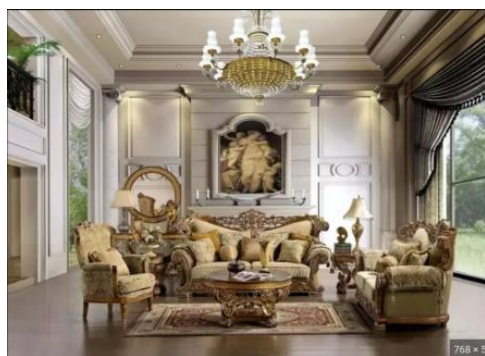
Slika 5: Referentna slika za enterijer sa najvišim nivoom vizuelne kompleksnosti

Referentna slika za enterijer sa najvišim nivoom vizuelne kompleksnosti se svojim odlikama jasno razlikuje od prethodne dve. Enterijer koji prikazuje je zahtevan, težak i ispunjen dekoracijom. Prisutni su kompleksni arhitektonski elementi sa gipsanim radom, ornamenti, raznolikost materijala i bogata dekoracija.