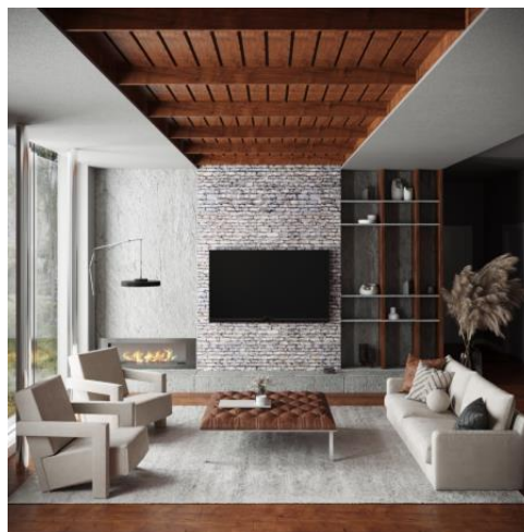
Slika 4: Izrada enterijera prema referentnoj slici za enterijer sa srednjim nivoom vizuelne kompleksnosti