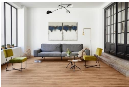
Slika 1: Referentna slika za enterijer sa najmanjim nivoom vizuelne kompleksnosti

Scena sa najmanjim nivoom vizuelne kompleksnosti rađena je prema referentnoj slici navedenoj u nastavku. Odlike prostora, iako upadljive, u celini čine svedeni enterijer. U pitanju su veliki otvori koji omogućavaju protok svetlosti kroz prostoriju, linijski nameštaj, čiste, jasne granice i upotreba neutralnih boja, sa određenim akcentima.