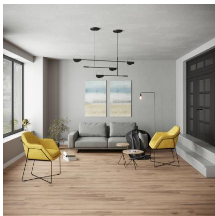
Slika 2: Izrada enterijera prema referentnoj slici za enterijer sa najmanjim nivoom vizuelne kompleksnosti