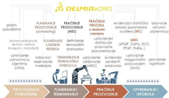
Slika 2. Prikaz svih modula u DelmiaWorks

Ovi moduli pomažu preduzećima da optimiziraju svoju proizvodnju, smanje troškove, poboljšaju efikasnost i povećaju kvalitet proizvoda.