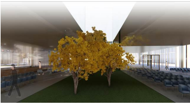
Slika 4 – Prikaz dela enterijer (prizemlje)