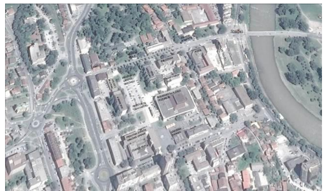
Slika 1 – Prikaz lokacije sa okolnim objektima

Prostor glavnog gradskog trga (Trg Bosne i Hercegovine), zajedno sa prostorom na kom treba da se izgradi objekat Gradske kuće trenutno funkcioniše kao prostor za parkiranje automobila zaposlenih u objektima koji okružuju i tranzitna zona za pešake. To jasno ukazuje da će novo arhitektonsko rešenje, zajedno sa urbanističkim rešenjem trga, doprineti oživljavanju prostora.