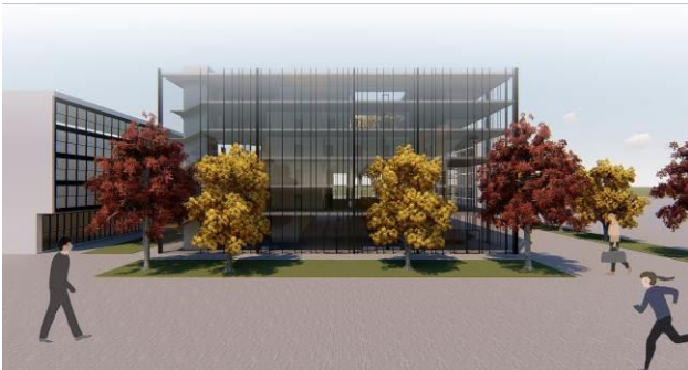
Slika 5 – Prostorni prikaz objekta Gradske kuće