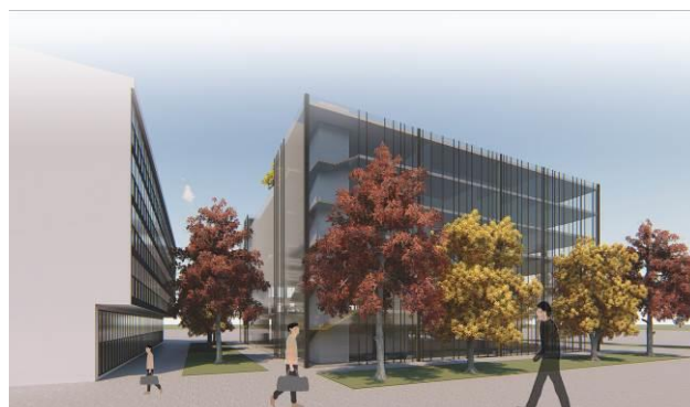
Slika 3 – Prostorni prikaz objekta Gradske kuće

Čelični stubovi, grede i čelične tavanice koriste se kao primarni noseći elementi konstrukcije.