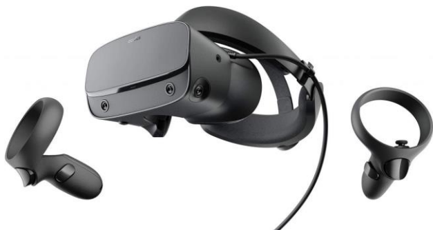
Slika 1. Oculus Rift oprema

Za primenu VR-a je osim opreme potreban i računar određenih specifikacija, kako bi doživljaj bio kompletan. Preporučuje se upotreba desktop računara, jer laptop računari ne garantuju podršku VR uređaja. Za projekat prikazan u ovom radu je korišćen Oculus Rift .