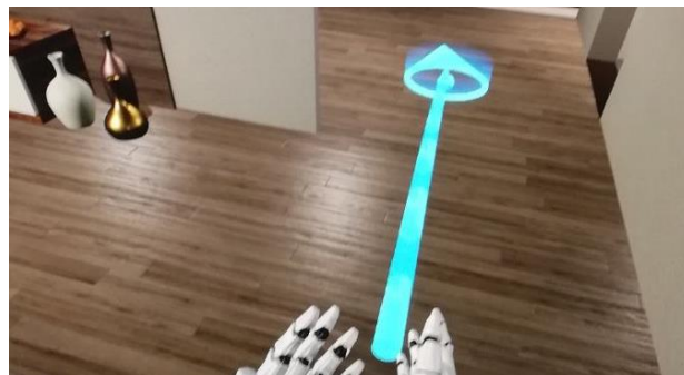
Slika 3. Teleport kroz scenu

moguće je preći na primenu VR-a u arhitektonskoj vizualizaciji. Potrebno je odrediti koje će opcije korisnik moći da koristi prilikom virtuelne šetnje kroz scenu, a u okviru rada na jednorodnoj kući moguće je vršiti teleportaciju kroz prostor, hvatanje pojedinih modela, podizanje i premeštanje ili bacanje istih, kao i menjanje modela unutar scene uz pomoć kontrolera.