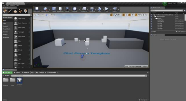
Slika 2. Interface first-person template-a

Određeni segmenti scene treba da budu interaktivni u određenoj meri. Mogućnosti kretanja kroz prostor treba da budu ograničene, kao i mogućnost interakcije sa određenim elementima u sceni. Mora da postoji razlika između onoga kako korisnik može interaktivno da reaguje na scenu u softveru. Jedan način je da učestvuje u sceni koristeći računar, kada se interakcija obavlja putem first-person template-a , a drugi način je da se interakcija odvija putem VR template-a , kada je korisniku, pored računara, potrebna i odgovarajuća oprema kako bi interakcija mogla da bude kompletna.