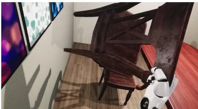
Slika 5. Hvatanje stolice pomoću kontrolera

iskoristi kompleksna kolizija, jer postoji mogućnost da se postavljanjem obične kolizije na kompleksniji asset neće dobiti isti efekat, kao kada se na kompleksniji objekat stavi kompleksna kolizija.