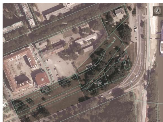
Slika 1. Odabrana lokacija ( www.geosrbija.rs )

Odabrana lokacija nalazi se u zapadnom delu grada uz reku Dunav, slika 1. Ima dobru povezanost sa ostatkom grada. Lokacija pruža izuzetan pogled na Dunav i Petrovaradinsku tvrđavu.