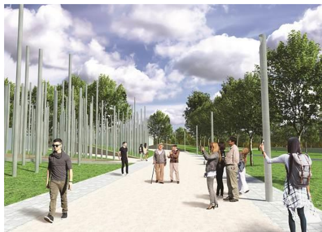
Slika 3. Park i spomen obeležja

Spomen prostor stradalima u Prvom svetskom ratu, Drugom svetskom ratu i Jugoslovenskim građanskim ratovima predstavljen je kroz veliki broj jednostavnih i identičnih struktura, odnosno cevi od čelika. One zajedno predstavljaju šumu izgubljenih života tokom ratova. Jedina razlika među njima je u visini kako bi se simbolički predstavila raznolikost stradalih, slika 3.