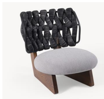
Slika 4. Stolica Moroso, Biknit Korišćena u ugostiteljskim prostorima

Komadi nameštaja koji su korišćeni u enterijeru predstavljaju svetski poznata dizajnerska dela poznatih arhitekata i uklapaju se svojom formom, materijalizacijom, kao i izborom boja, u enterijer centra za kulturu i tradiciju.