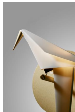
Slika 3. Specifčno ambijentalno osvetljenje

Budući da objekat centra za kulturu i tradiciju definiše raznovrsnost sadržaja i ambijenata, u skladu sa tim moralo se pristupiti i rešavanju osvetljenja takvog polivalentnog prostora. Osnovni vid rasvete u čitavom objektu predstavlja ambijentalno osvetljenje, koje naglašava karakteristike enterijera u smislu dimenzije i materijalizacije, te obezbeđuje dovoljan nivo osvetljenja bez bljeska. Akcentovano osvetljenje planirano je u pojedinim zonama, kao što je izložbeni prostor i ugostiteljski prostor. U zonama koje su namenjene radu i aktivnom uvežbavanju i stvaranju, planirano je radno osvetljenje koje poboljšava uslove za rad i učenje.