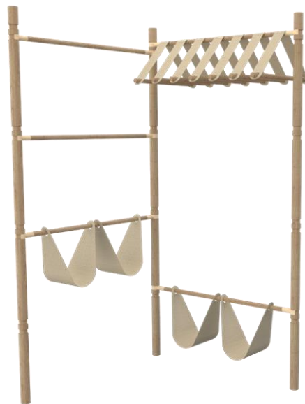
Slika 3. Prostorni prikaz otvorenog ormara

U duhu serije i u skladu sa pređašnjim istraživanjem, za materijale su odabrani drvo i platno. U konstruktivnom smislu „Misto“ je moguće podeliti na noseći sklop i jedinice za odlaganje. Skelet ormara čine drveni štapovi visine 75 cm koje je moguće nastavljati jedne na druge, na tim štapovima se nalaze žlebovi na koje se kače plastični nastavci horizontalnih nosača. Ovakvim spojem se olakšava i ubrzava spajanje ormara. Sami horizontalni nosači, osim držanja konstrukcije, mogu da posluže i za odlaganje većih odevnih predmeta. Jedinice za odlaganje dolaze u dva oblika. Tip 1 je isti kao kod čiviluka i sastoji se od prostog platnenog romba sa rupama preko kojih se kači na drveni štap. Njegova osnovna namena je odlaganje manjih odevnih predmeta (složene majce, patike, čarape, donji veš, kišobran...). Tip 2 se sastoji od platnene trake koja se na oba kraja kači na mali drveni element pa se potom prebaci pomoću platna preko već spomenutih horizontalnih štapova. Na taj način se formira struktura slična ofingeru i osnovna namena ovog elementa je upravo da služi za odlaganje kabastijih odevnih predmeta (kaputi, jakne, sakoi...).