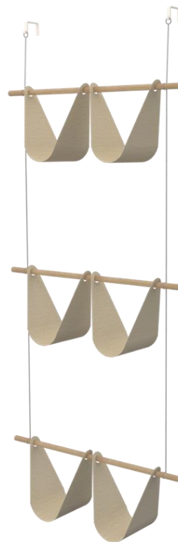
Slika 1. Prostorni prikaz čiviluka

Čiviluk je komad nameštaja čija je osnovna funkcija kačenje stvari. Uglavnom se misli na slobodnostojeći element ili set kuka zakačenih na zid i koristi se za kačenje kaputa, jakni, kišobrana i šešira. Polazeći od tradicionalnog modela čiviluka, istraživanjem oblika,