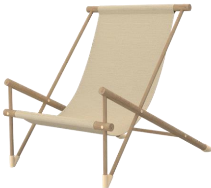
Slika 2. Prostorni prikaz stolice

Stolice i fotelje za odmor, često nazivane laundž stolicama (lounge chair) dizajnirane su tako da korisnik ima više prostora, kako bi se što udobnije smestio. Ovakve stolice su najčešće planirane za opuštanje i odmor, pa samim tim ne pretpostavljaju interakciju korisnika sa drugim ljudima ni drugim komadima nameštaja, osim eventualno klub stočića. One su orijentisane same ka sebi, i zbog toga najčešće mogu da budu proizvoljno orijentisane u prostoru.