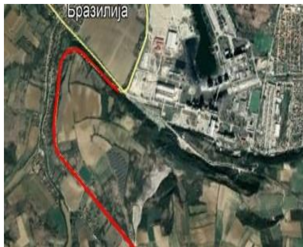
Slika 1. Dionica puta Beočin - Bešenovo