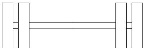
Slika 3. Jednostruka osovina sa udvojenim točkovima

Opterećenja različitog intenziteta i broja ponavljanja (realni saobraćajni tok sa različitim učešćem pojedinih klasa vozila), transformišu se u ekvivalentan broj „standarnih“ ili „ekvivalentnih“ opterećenja, podrazumijevajući istu veličinu oštećenja kolovozne konstrukcije. Opšte prihvaćeno standardno opterećenje je ekvivalentna jednostruka osovina sa dva udvojene točka, opterećena sa 82KN.