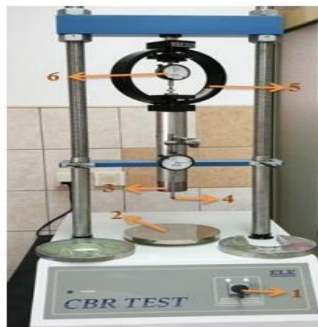
Slika 4. Uređaj za određivanje vrijednosti CBR-a

Nosivost materijala posteljice izražava se pomoću vrijednosti CBR, koja se određuje prema standardu SRPS U. E8. 010.