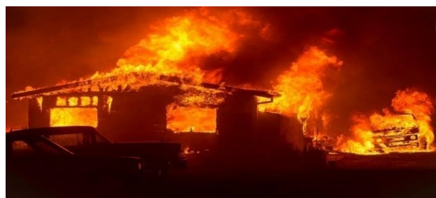
Slika 1: Požar

Ukoliko neki od navedenih uslova nije ispunjen pojava vatra neće biti moguća.