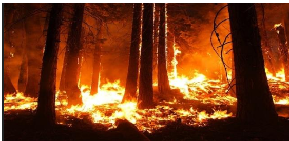
Slika 2: Šumski požar ( izvor:

Šumski požari spadaju u grupu požara na otvorenom prostoru. Šumski požar, kao što i sama reč kaže, je požar koji nastaje u šumama, dok je požar otvorenog prostora bilo koji požar koji se ne događa u zatvorenom prostoru (Slika 2).