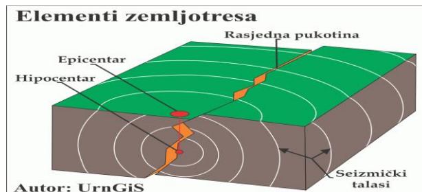
Слика 4: Земљотреси

Epicentar jeste projekcija Hipocentra na površini zemlje i podrazumeva mesto na kome se zemljotres najviše oseća.