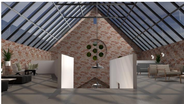
Prikaz 4: pod „vedrim nebom“

Kao još jedan vid stvaranja atmosfere savremenim sredstvima, centralno jezgro stepeništa prvog sprata takođe može da posluži za izlaganje, s toga je šinska rasveta pozicionirana u okolini. Drugi sprat je pak naklonjen intimnijoj atmosferi. Tokom dana obezbeđen je dnevnim osvetljenjem preko staklene krovne konstrukcije, a noću je grupisano spuštenim visilicama kako bi korisnicima omogućila intimnost i uživanje pod „vedrim nebom“. 1