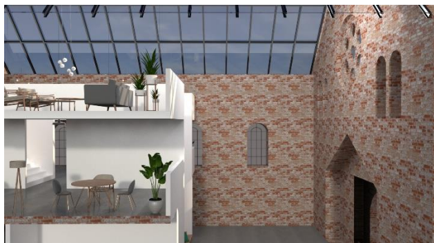
prikaz 2: Iskorišćenost visine objekta

Galerijski prostor se nalazi preko puta glavne fasade sa rozetom tako da se korisnik takozvano „lice u lice“ susreće sa njom. Predstavlja jedan od glavnih scenskih repera tokom projektovanja, atmosferu koju stvara u dualizmu sa prirodnim osvetljenjem tokom dana ostavlja posmatrača bez daha. To je zapravo već prostor u koji vas je autor uvukao, bez korišćenja bilo kakvog marketinškog sredstva, a da toga niste ni svesni. Prostor unutar prostora, scena unutar scene, jeste i glavni cilj sa kojim je stvorena određena atmosfera.