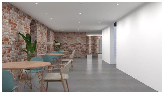
prikaz 3: enterijersko uređenje I sprata

Sve pregrade između prostora apsida i ostatka celine su staklene, tako da se i sa njima ostvaruje fleksibilnost, transparentnost i transformacija prostora.