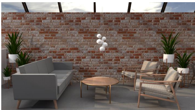
Prikaz 5: Mid century mobilijar

Mobilijar je u ovom kontekstu izabran sa ciljem da bude udoban i funkcionalan. Uglavnom je korišćen mid century stil koji je nenametljiv i lako dostupan. U prostor je inkorporiran nameštaj poznatih dizajnera kao što su Jean Priuve, Konstantin Grcić, Isamu Noquchy, Patricia Urquila.