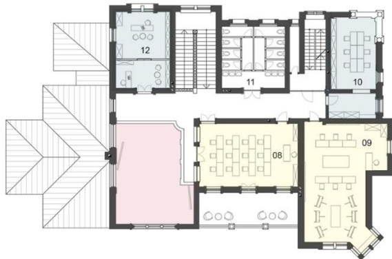
Legenda: 08 - Učionica za digitalna predavanja 09 - Kombinovana učionica 10 - Zbornica 11 - WC 12 - Upravnik

Na taj način je izvršena podela komunikacija, odnosno prilikom pristupa u objekat glavnim ulazom, pristupa se muzeju. Povezan je sa kafeterijom, salom za predavanje/galerijom, kao i vertikalnom komunikacijom sa upravom objekta. Sporedni ulaz je namenjen studentima gde pri ulazu imaju prostor sa ormarićima za odlaganje stvari.