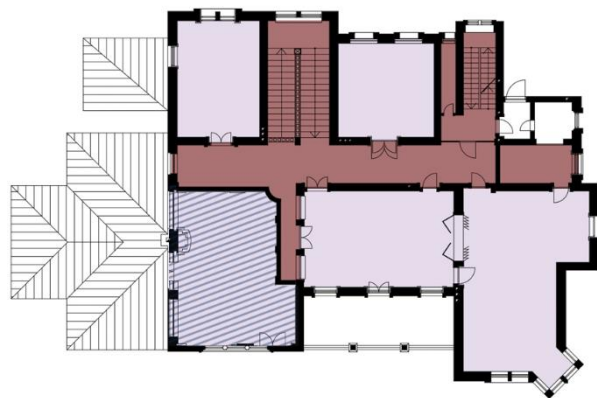
Slika 2 - Osnova sprata sa prostornom organizacijom

Na spratu se u središnjem delu takođe nalazi komunikacijski koridor, koji deli osnovu na deo okrenut ka severu i onaj orijentisan na jug. On se prostire celom dužinom osnove i završava se na balkonu galerijskog prostora, sa pogledom na ulazni hol, u prizemlju, ispod njega. Spratni deo imao je funkciju odmora porodice vlasnika.