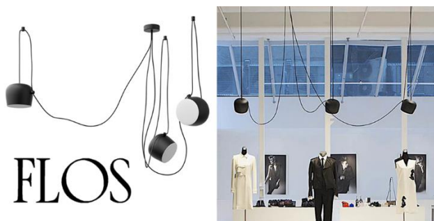
Slika 7 - Aim - Flos rasveta

Kao rasveta se koristi LED Aim, proizvođača Flos. Ideja je da se deo visilica ponaša kao ambijentalno svetlo bez posebnog usmerenja dok se drugi deo ponaša kao akcentovano svetlo i naglašava ornamentiku, komunikaciju sa drugim prostorijama kao i privremeno izložene radove.