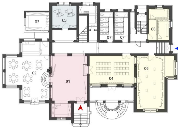
Legenda: 01 - Muzej sa portimicom / suvernimicom 02 - Kafeterija sa ostavom 03 - Administracija 04 - Sala za predavanje 05 - Galerija 06 - Prostor za odlaganje ličnih stvari studenata 07 - WC ▲ Glavni ulaz ▲ Ulaz za studente