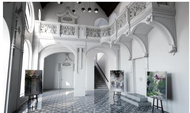
Slika 6 - Vizuelizacija revitalizovanog ulaznog hola

Jedan od četiri prostora koja su detaljno razrađena u cilju boljeg razumevanja revitalizacije dvorca porodice Špicer je ulazni hol, kao najdominantniji prostor i glavni predstavnik raskoši.