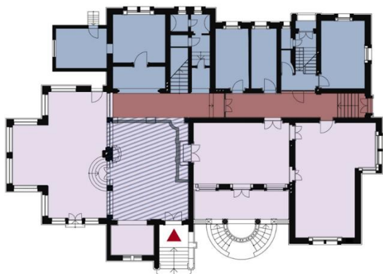
Slika 1. Osnova prizemlja sa prostornom organizacijom

Kao i kod većine objekata ove tipologije, sadržaj je podeljen komunikacijskim koridorom (na slici 1 i 2 obeležen crvenom bojom) na dve zone: rezidencijalni deo gde su boravili vlasnici i gosti (na slici 1 i 2 obeležen ljubičastom bojom) i opslužujući deo gde je bila smeštena posluga (na slici 1 obeležen plavom bojom).