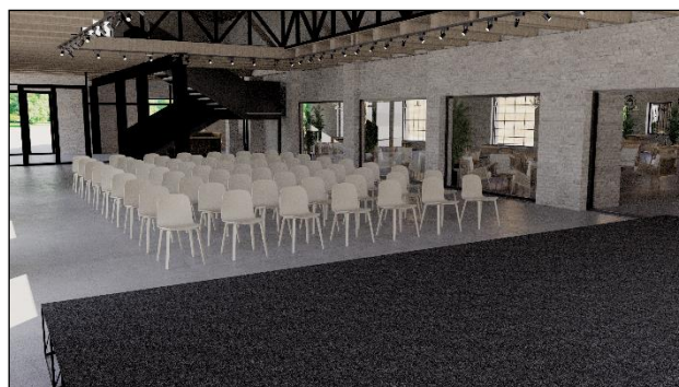
Slika 4. 3D prikaz multifunkcionalne sale