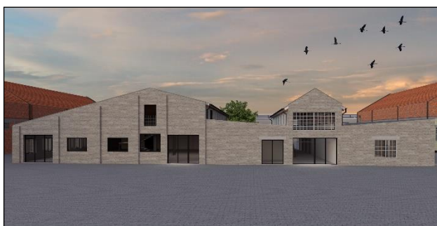
Slika 1. 3D prikaz eksterijera objekta

Ove tri zone povezane su glavnim ulaznim holom preko koga se ostvaruje veza sa javnim prostorom Kineske četvrti.