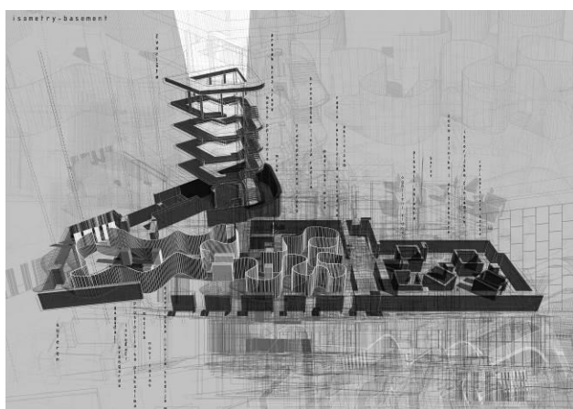
Slika 2. Šematski prikaz suterena i čvorišta

Prostor suterena je u vrijeme funkcionisanja objekta bio namjenjen za arhivu i skladištenje. On jeste baza objekta, prva ploča koja je nastala u procesu izgradnje. U skladu sa tim, odabran je kao prvobitno mjesto susreta sa istinskim artefaktima, koji čine istoriju života objekta i svega onoga što je proizilazilo kao produkt stvaralaštva u njemu. U muzeju su na specifičan način izloženi svi vrijedni ostaci iz objekta poput snimljenih ploča, novinskih članaka ili neupotrebljive opreme za snimanje. Novoformirano arhitektonsko okruženje adekvatno pobuđuje sva čula uz propratne senzacije, sa ciljem poboljšanja kontakta sa okolinom te njenog razumjevanja. Istovremeno sa njim proširuje se polje u okviru kojeg je moguće sagledavanje budućih akcija u objektu te formiranje revolucionarne, radikalne misli o novoformiranom prostoru kao i ohrabrenje kreativne reakcije na postojeće artefakte.