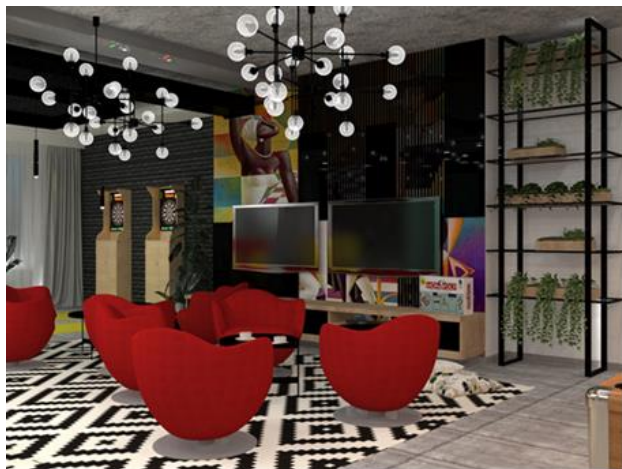
Slika 2. Soba za zabavu – fun room

Nalazi se na sedmom spratu objekta, i zauzima polovinu etaže, i poseduje čak i izlaz na terasu koja može služiti za ispijanje omiljene kafe ili čaja uz ćaskanje. Ona služi kako bi se zaposleni zabavljali, družili ili opustili uz omiljenu knjigu. Osmišljena je tako da svako može da pronade svoj omiljeni kutak unutar nje. Ceo fun room zaista će izgledati kao jedan prava soba za zabavu. Oslikane zidne površine doprinose harmoničnosti prostora. Detalje u prostoru predstavlja zelenilo u saksijama, koje se pojavljuju i na čeličnim policama u pravugaonim drvenim saksijama, dok su predviđena i mesta za veštačko zelenilo.