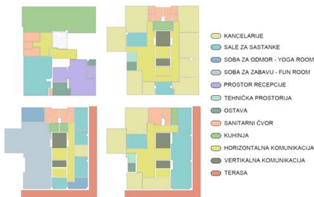
Dijagram 1.: Šematski prikaz koncepta na etažama.

Predviđeno je da se na celu etažu osmog sprata postave konferencijske sale i direktorske kancelarije za primanje stranki. One su postavljene na najviši nivo iz razloga da bi se obezbedili mir i privatnost prilikom ozbiljnih poslovnih sastanaka.