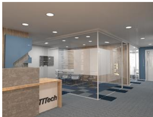
Slika 1. Pogled na kancelarije iz hodnika.

Pravilnim odabirom podne obloge se može podići kvalitet radnog prostora. Posebno je važno obratiti pažnju na kancelarije, al i na hodnike. Kada se bira podna obloga, mora se voditi računa o tome da ona bude udobna, i da smanjuje nivo buke u prostoru. Sa njom možemo čak i doprineti harmoničnosti. Itison, u obliku ploča 50x50cm je bio moj izbor. Istraživanjem se došlo do toga da itisoni imaju funkciju i termoizolacije i zvučne izolacije. Za mene su ove podne obloge predstavljale inspiraciju za uvođenjem boja u prostor, kao za stvaranje vizeulnih barijera između prostorija različitih namena, misleći na hodnike, kancelarije i konferencijske sale. Plava boja predstavlja zaštitnu boju ove kompanije. Kao što je u radu već pomenuto, utiče na smirenost, stabilnost i balans. Takođe, podstiče kreativnost pa je zbog toga i savetuje njena pojava u kancelarijama gde se odvijaju neki kreativni poslovni. Iz tog razloga sam se odlučila da se upravo ta boja pojavi na podu.