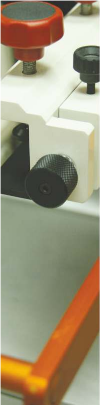
SITO MAŠINA S550 Za ravnu i cilindričnu štampu