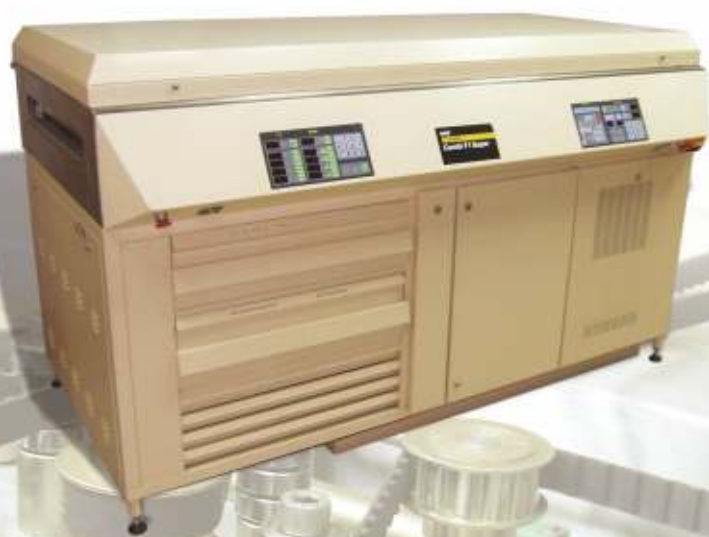
Nyloflex Combi FI Super