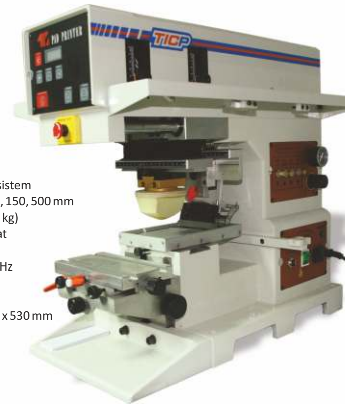
MAŠINA ZA TAMPON ŠTAMPU 1-1010